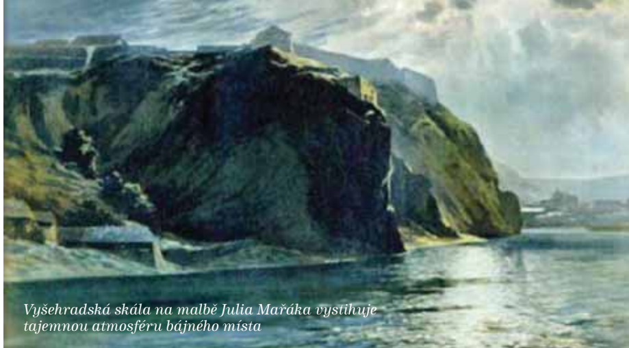
Vyšehradská skála na malbě Julia Mařáka vystihuje tajemnou atmosféru bájného místa