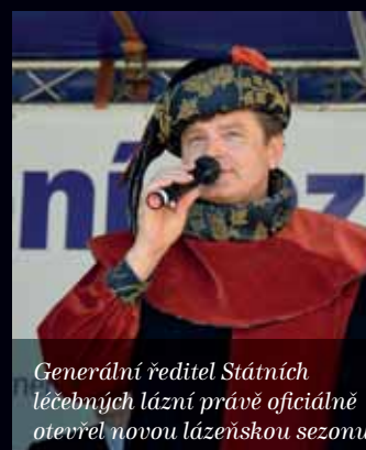
Generální ředitel Státních léčebných lázní právě oficiálně otevřel novou lázeňskou sezonu.