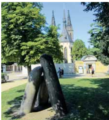
Tzv. Čertovy sloupy upomínají na předkřesťanský kult „Kroková kamene“

je značně rozšířené pojmenování pro sídla Slovanů, obecně ve významu opevněného „města“ ve výšinné poloze na kopci či ostrožně chráněné svahy. Vyšehrady známe z Polska i Panonie, několik Višegradů je také v Srbsku. Samo jméno není tudíž nijak výjimečné a pro bájnou minulost našeho Vyšehradu není vodítkem. Vyšehrady naopak může být původním pojmenováním