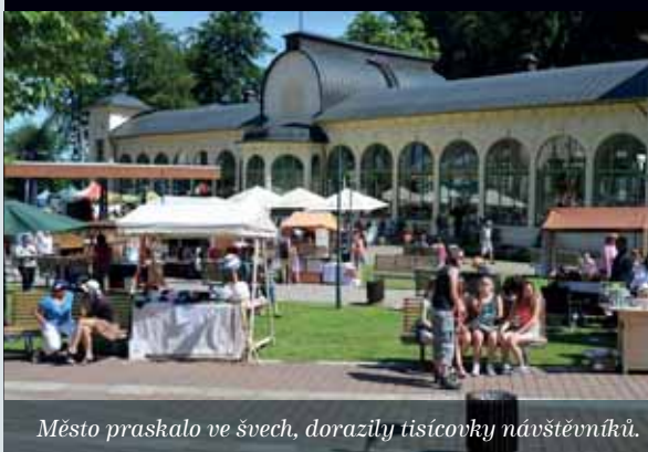
Město praskalo ve švech, dorazily tisícovky návštěvníků.