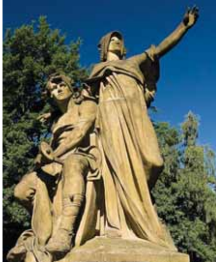
Jméno vědmy Libuše je přesmyčkou jména starořecké kněžky Kumské Sibylly

Kosmas píše o poloze u vsi Zbečna, kde nad řekou Mží ční z vody skála, v místním povědomí známá jako Kazín. Mohutným skaliskem nad touž řekou je Tetín, dávné hradíště spojované s posledním soudem – obětí – kněžny svatě Ludmily. Kazi i Teta, obě byly v Kosmově podání dcerami soudce Kroka. Krokovo sídlo pak lidová tradice klade na vyšehradskou skálu, nedaleko soutoku Mže a Vltavy, kde svůj bájný hrad měla třetí a nejvýznamnější z Krokových dcer, již Kosmas pojmenoval Libuše, latinsky Libissa. Skála nad řekou byla místem věstec-kých výroků a soudů nad spory lidí. Kosmova zmínka o zdejším jménu Chrasten pak pozoruhodně zapadá do bájeslovné historie. Název nemá nic společného s hradem z chrastí. Latinský zápis Hvrasten nepřesně interpretoval fonetické znění, které mohlo být Krasten, Krakstein – Krokův neboli Krakův kámen! Skála – stein, stone související s kultem bájného Kraka. Její rituální význam ještě umocňuje orientace strmé stěny k západu, nad vodou „zánik“ slunečního svitu otevírá vstupní bránu do podsvětí.